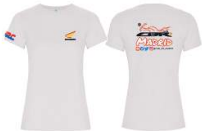
Camiseta algodón entallada 12,90€