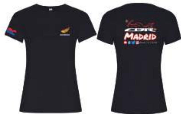
Camiseta algodón entallada 12,90€