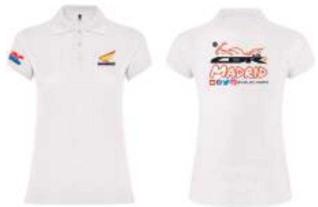
Polo manga corta entallado 15,50€ Polo manga corta entallado Bordado 25,50€