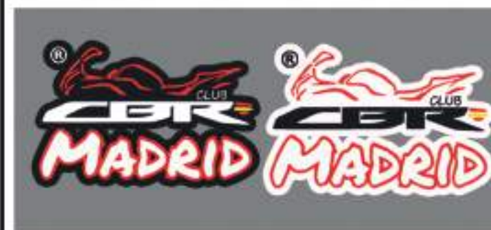
vinilo adhesivo laminado 8cm de ancho 2,00€ vinilo adhesivo laminado 10cm de ancho 3,00€

Mascarilla personalizada en negro, blanco con nombre o logo de honda completo disponible en siete tallas para un mejor ajuste. Este producto requiere de 7 días para su confección. 8,00€