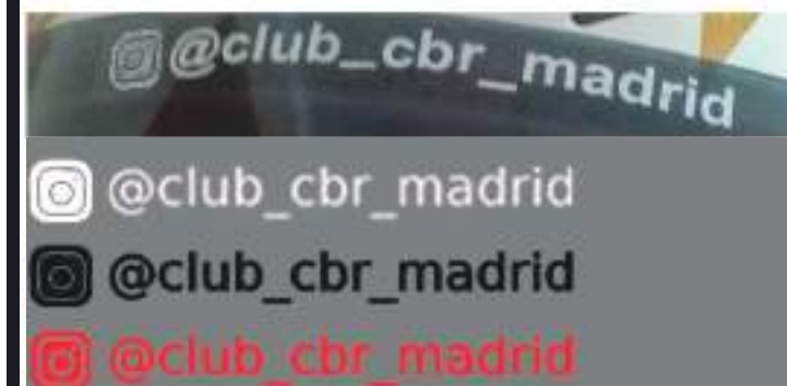
vinilo adhesivo Blanco visera casco 25cm 2,50€ vinilo adhesivo Para cupula 10cm 1,50€