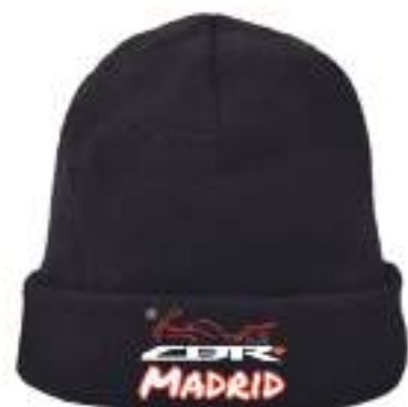
Gorro 5,00€ Gorro Bordado 8,00€