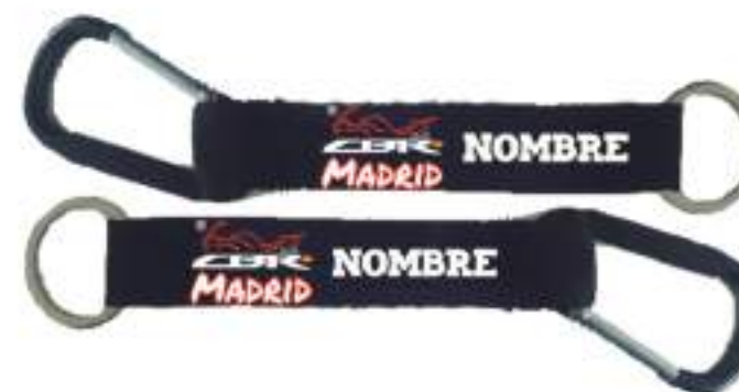
Llavero mosqueton 4,00€