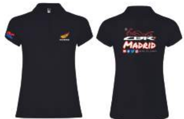
Polo manga corta entallado 15,50€ Polo manga corta entallado Bordado 25,50€