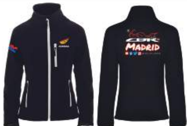
Chaqueta Soft shell entallada 28,00€ Chaqueta Soft shell entallada Bordada 38,00€