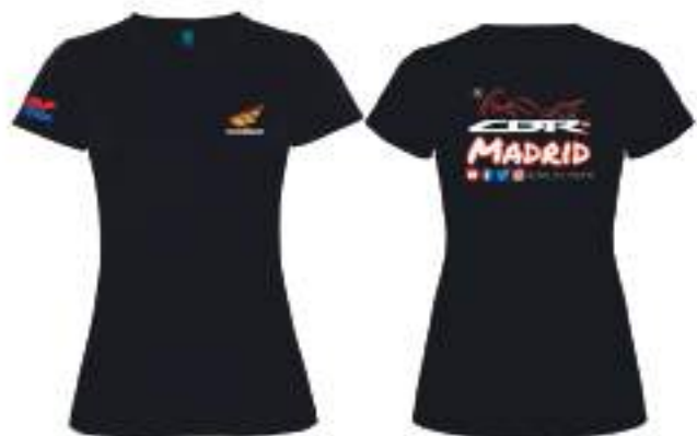
Camiseta tecnica (poliester) entallada 12,90€