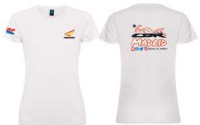
Camiseta tecnica (poliester) entallada 12,90€